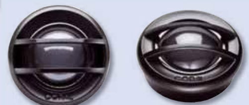
Die Hochtöner PRX 28 erfüllen hohe klangliche Ansprüche