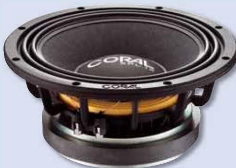
Technologisch ausgereift: der XPL 12