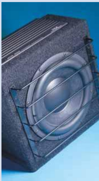
Die Aktivbox XTR 300 mit Class-D-Verstärker