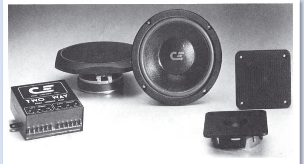
Das Zweiwege-System HPH 702