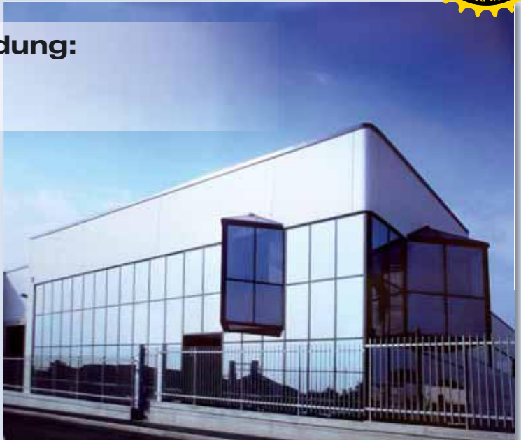
Dies ist die Geburtsstätte vieler Innovationen

dass es für realitätsgetreue Wiedergabe mehr braucht als moderne Computertechnologie. Daher bleibt bei aller Innovation stets eine Konstante: Wenn bei Coral ein neuer Lautsprecher oder Verstärker entwickelt wird, werden die neuesten Designtechnologien und Messmethoden stets durch ein extrem wichtiges „Werkzeug“ ergänzt: das menschliche Ohr. Und einer große Portion Leidenschaft für Musik.