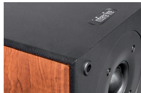
Tadellos ausgeführte Details: Seitenwangen in Holzdekorfolie verleihen der Nota 550 eine elegante Note

Fazit Zu einem äußerst fairen Preis bietet Indiana Line mit der Nota einen ausgereiften, erwachsen klingenden Standlautsprecher, der